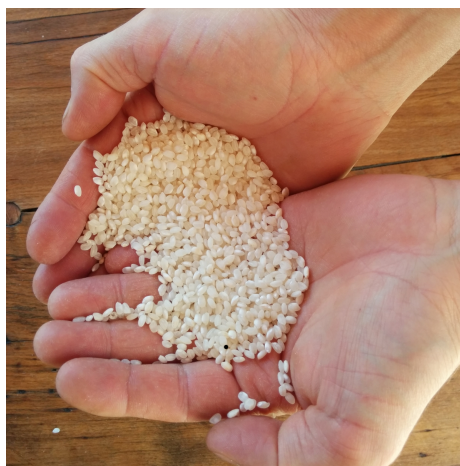
Riz Japonica origine Italie, plaine de Voghera

Pour plus de renseignements contacter le moulin Chambelland par mail: hilda@chambelland.com