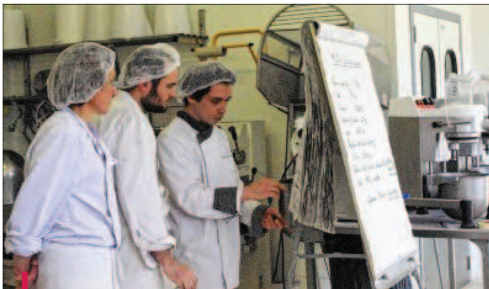
Après plus de 4 mois passés en alternance dans la vallée du Jabron et en entreprise, chacun des stagiaires pourra s'engager dans son projet professionnel : artisan boulanger bio.

Les stagiaires, dans le cadre de cette reconversion vont devenir